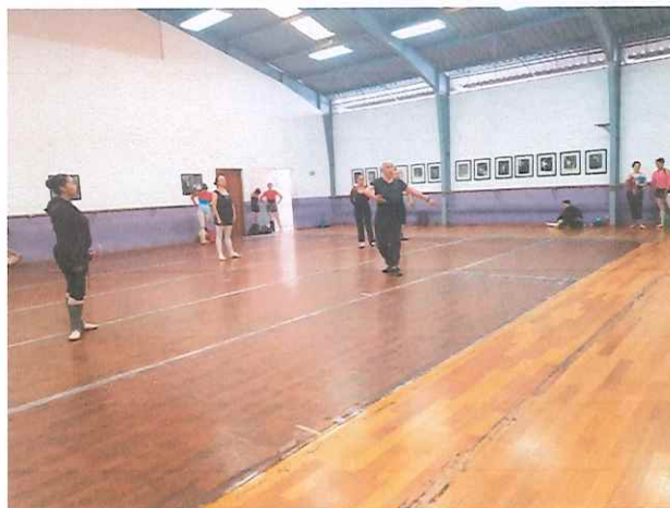
Clase de danza clásica para los integrantes del Ballet Nacional de Guatemala