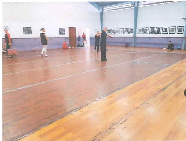
Clase de danza clásica para los integrantes del Ballet Nacional de Guatemala