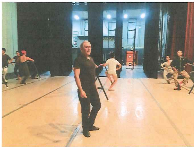
Supervisión de la clase impartida a los integrantes del Ballet Nacional de Guatemala