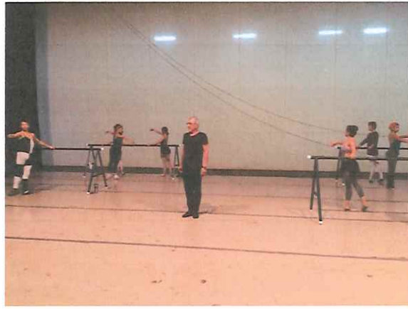
Clase de danza impartida para los integrantes del Ballet Nacional de Guatemala