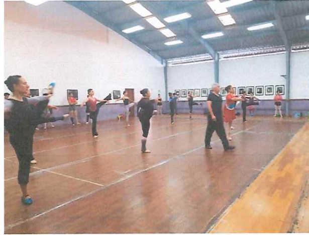
Indicación de los pasos a llevar a cabo en clase con los integrantes del Ballet Nacional de Guatemala