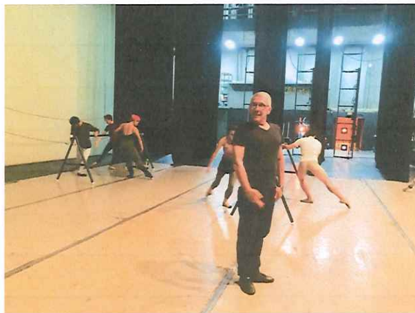
Supervisión de la clase impartida a los integrantes del Ballet Nacional de Guatemala